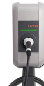
Keba P30 C-Series