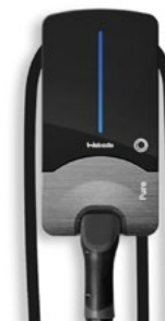
Webasto PURE 11 kW